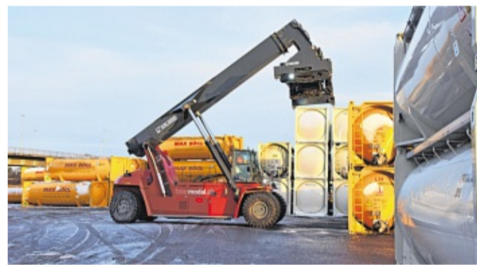
Am Terminal für den kombinierten Güterverkehr Schiene/Straße verladen Greifstapler die von Lkw angelieferten Container auf die Bahn.

Auch die geplante Velo-Route 1 vom Hauptbahnhof bis zum Einfelder See mit der dafür nötigen Bahngleisunterquerung gehört zum Potpourri der angestoßenen Planungen, die jetzt im Status der frühen Vorhabenbe-